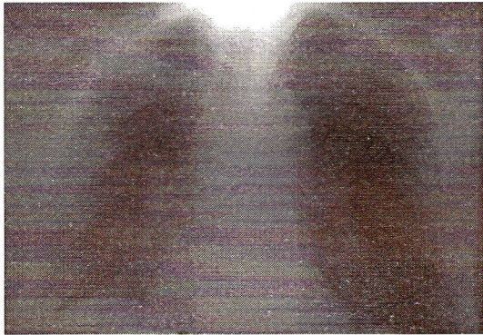
Fig. 4: Radiografía de tórax un mes luego del alta.

Un mes después del alta, el paciente se encontraba clínicamente estable y sin síntomas respiratorios. La radiografía de tórax evidenciaba resolución completa de las lesiones. (Fig. 4).