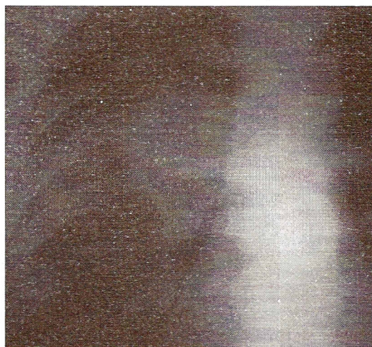
Fig 1 A y B: Radiografía de tórax al ingreso.

La radiografía del miembro inferior derecho mostraba enfisema subcutáneo.