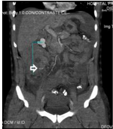
Figura 1(A y B): TCMD con contraste EV: hematoma organizado en relación a colon ascendente (flechas negras), con signos de sangrado activo (flechas pequeñas). Líquido libre intraperitoneal, correspondiente a hemoperitoneo (flechas curvas).