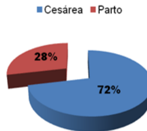
Vía de Finalización

Al analizar los resultados perinatales encontramos que el 55 % (90) eran de término: edad gestacional entre las 37 y 41 semanas, mientras que el 45 % (75) fueron pretérmino: edad gestacional menor a 37 semanas.